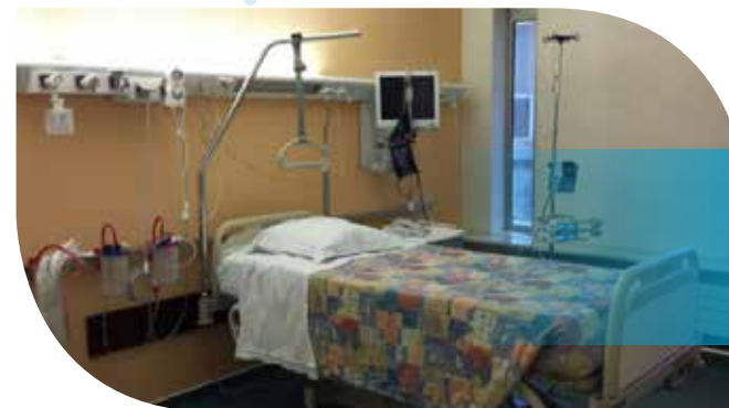
Chambre médicalisée en soins continus